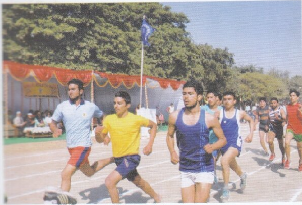
दौड़ में भाग लेते प्रतिभागी