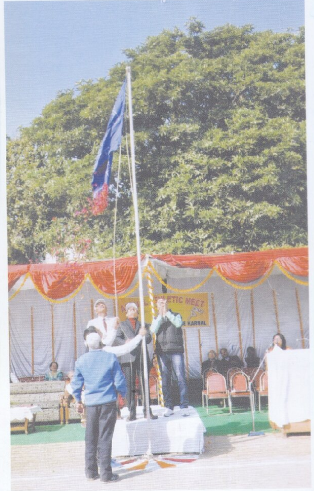
वार्षिक-खेलोत्सव में मुख्यातिथि द्वारा ध्वजारोहण