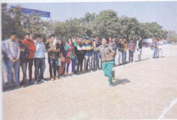
जैवलीन - श्रो करते हुए महाविद्यालय की छात्रा।